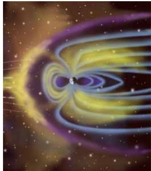
Das Magnetfeld der Erde wirkt wie ein gigantischer Schutzschild. Kosmische Strahlung wird abgelenkt und erreicht nur in stark abgeschwächter Form die Erde.