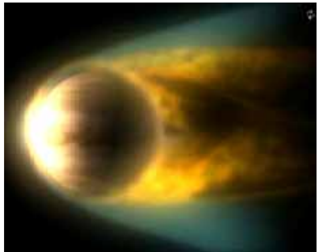
Venus mit Plasmaausstoß

Venusisches Plasma besteht großteils aus Ionen, elektromagnetisch aufgeladenen Teilchen. Elektromagnetisch aufgeladene Teilchen aber sind Träger von Informationen und somit Übermittler von Impulsen, die auf das menschliche Bewusstsein einwirken.