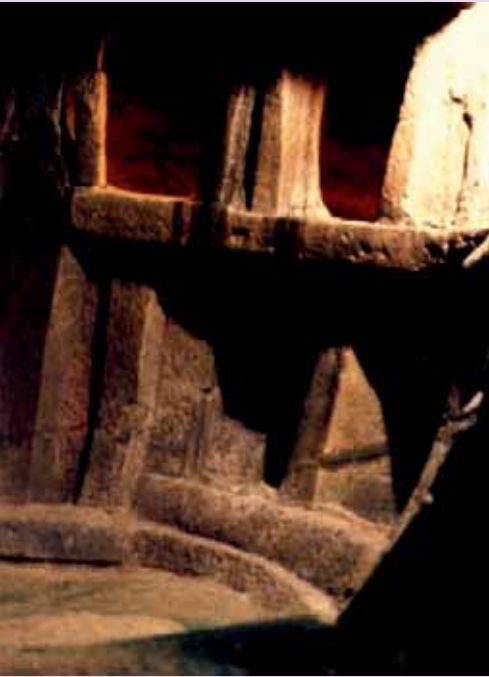
Das Hypogäum auf Malta.

Der Götterglaube (und in seiner schlimmsten Form der Eingottglaube) entstand erst dann, als dieses Wissen der All-Einheit dem Menschen verloren gegangen war. Wir sollten es uns daher eingestehen, dass ein Gott- oder Götterglaube nichts anderes als ein krankhaftes Symptom einer geistigen Verwirrung und einer Entfremdung von der in uns möglichen allumfassenden Liebesfähigkeit ist.